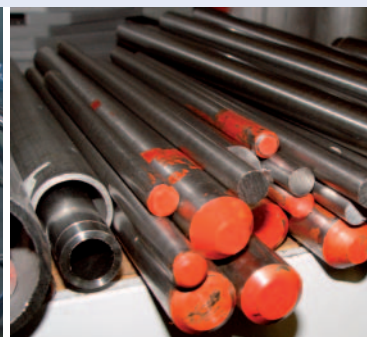
Glass, stainless steel, glass-lined steel, Hastelloy, Titanium, Tantalum, etc. Glas, Stahl rostfrei, Email, Hastelloy, Titan, Tantal usw.