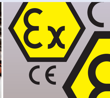
According up-to-date European and US regulations, codes and standards Nach den aktuellsten europäischen und US-Vorschriften.