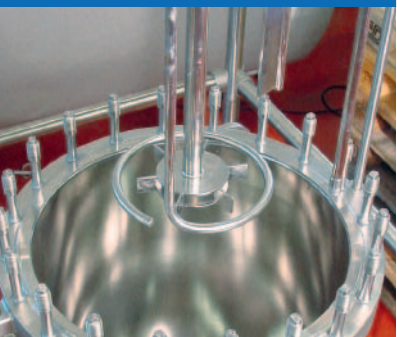
Turbine stirrer with gas inlet sparging tube for hydrogen Turbinenrührer mit Gaseinleit- brause für Wasserstoff