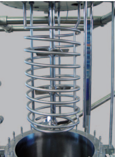
Internal cooling coil for emergency cooling Interne Kühlspirale für Notkühlung