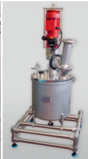
80 liter cGMP reactor Hastelloy C22 80 Liter cGMP Reaktor Hastelloy C22

Pressure reactors with large volumes are used for many different processes in chemical and pharmaceutical industries. We plan and build single reactors as well as skid mounted multiple reactor systems according to customer specification.