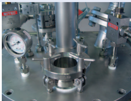
Manhole with sight glass Mannloch mit Schauglas