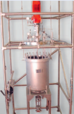
100 liter 50 bar hydrogenation reactor 100 Liter 50 bar Hydrierreaktor

Die Erfahrung unserer Engineering-Abteilung ist bei der Umsetzung individueller Kundenwünsche ein wesentlicher Faktor und trägt entscheidend zum Gelingen solcher Projekte bei.