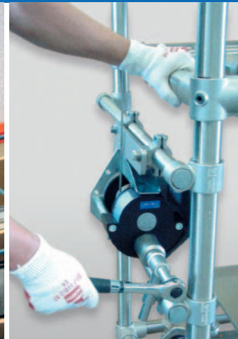
Lift for opening / closing of reactor vessel Lift zum Öffnen / Schliessen des Reaktors